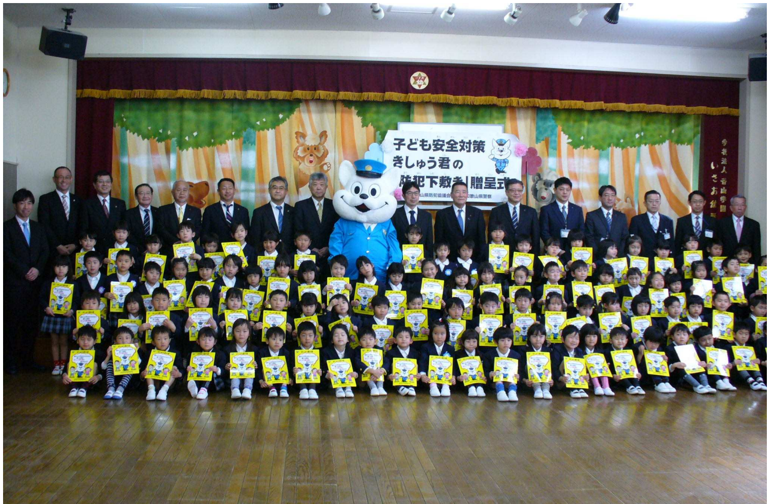
「きしゅう君の防犯下敷き」配布事業 3月10日和歌山市道場町の私立おのみなと幼稚園での贈呈式